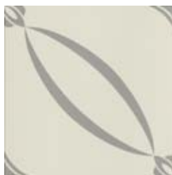
20x20 Berlino Grigio AHB6 - 134 MQ