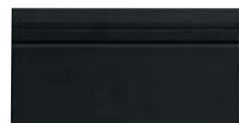
10x20 Zoccolo York OEZ5 - 105 PZ