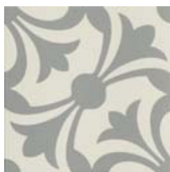
20x20 Lipsia Grigio AHL6 - 134 MQ