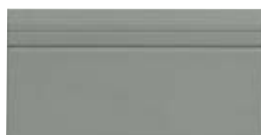
10x20 Zoccolo London OEZ6 - 105 PZ